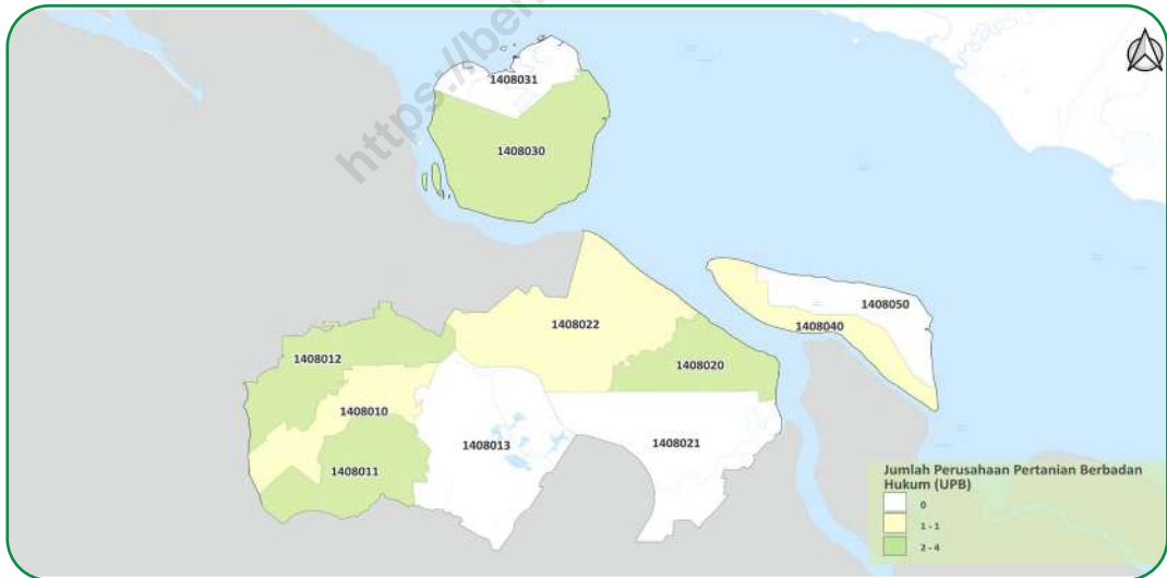
Gambar 2.2 Sebaran Perusahaan Pertanian Berbadan Hukum (UPB) di Kabupaten Bengkulu, 2023 Figures Distribution of Agricultural Corporation in Bengkulu Regency, 2023