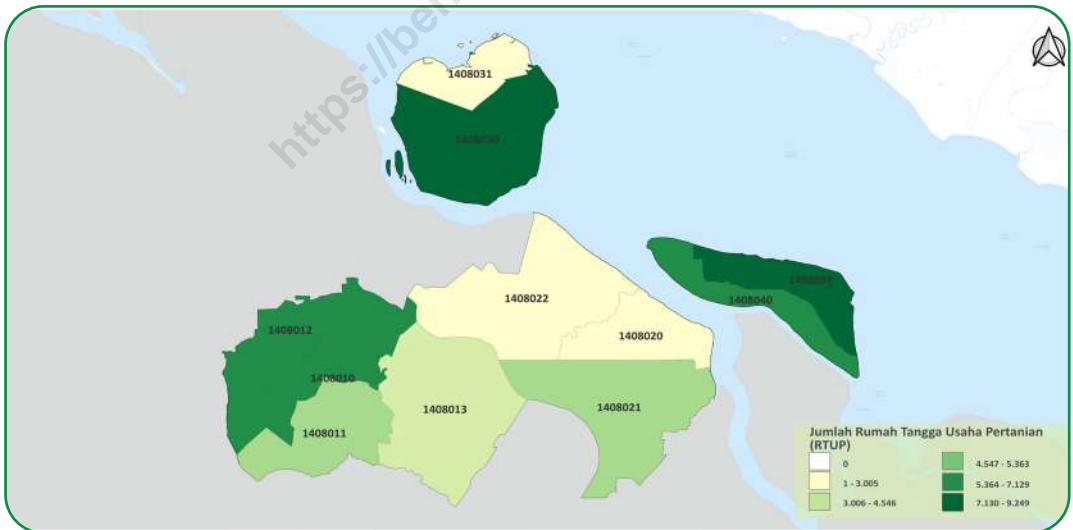
Gambar 2.4 Figures

Sebaran Usaha Pertanian Lainnya (UTL) di Kabupaten Bengkulu Selatan, 2023 Distribution of Other Agricultural Holding in Bengkulu Selatan Regency, 2023