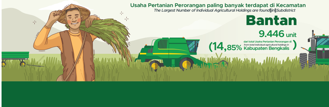
Gambar 1.2 Figures

(14,85% dari total Usaha Pertanian Perorangan di Kabupaten Bengkulu)