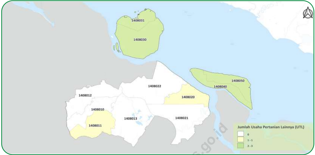
Gambar 2.3 Figures

Sebaran Usaha Pertanian Lainnya (UTL) di Kabupaten Bengkulu Selatan, 2023 Distribution of Other Agricultural Holding in Bengkulu Selatan Regency, 2023