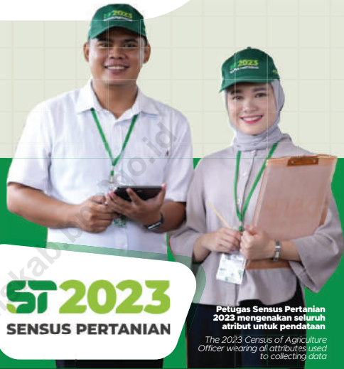
Petugas Sensus Pertanian 2023 mengenakan seluruh atribut untuk pendataan The 2023 Census of Agriculture Officer wearing all attributes used to collecting data